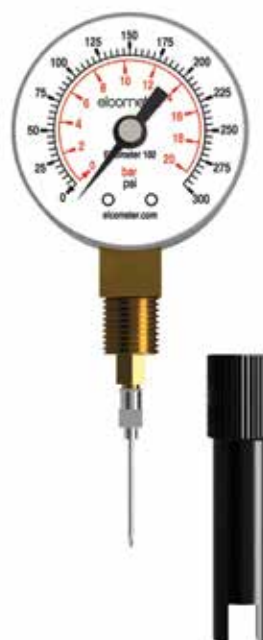
注射式圧力計の使用方法

ホース内の圧力が下がると、研磨剤の使用量が増え、洗浄効率と投锚効果も低下します。