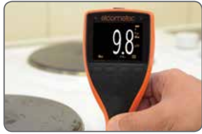
Ideaal voor het meten van de droge-laagdikte van dunne, gecoate substraten.