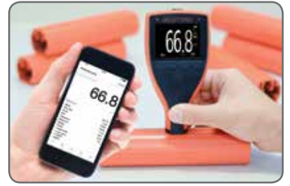
Directe gegevensoverdracht naar een pc, Android™ of iOS mobiel apparaat via Bluetooth® 2 .