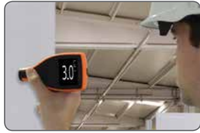
Automatisch 360° roterend scherm om waarden onder elke meethoek duidelijk te kunnen aflezen aan de productielijn van een QA-station.