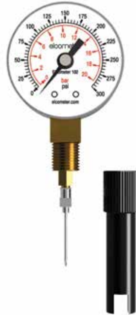
如何使用针式压力计