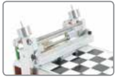
涂膜器和涂膜棒二合一附属装置